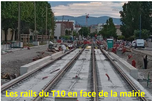
Les rails du T10 en face de la mairie

Après la mort de deux salariés de Elkem-Silicones lors d'une explosion en décembre dernier, la « Vallée de la Chimie » continue de faire l'actualité. Cette fois, c'est l'annonce le mois dernier de licenciements massifs chez Symbio (70% des effectifs, soit 358 postes) et chez Polytechnyl (86 % des effectifs, soit 475 postes). Derrière ces chiffres accablants, ce sont des familles entières qui sont touchées, et à qui nous exprimons notre solidarité et notre prière.