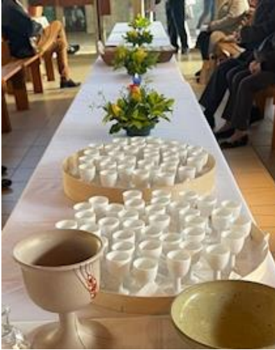
La table eucharistique du Jeudi Saint et le lavement mutuel des mains